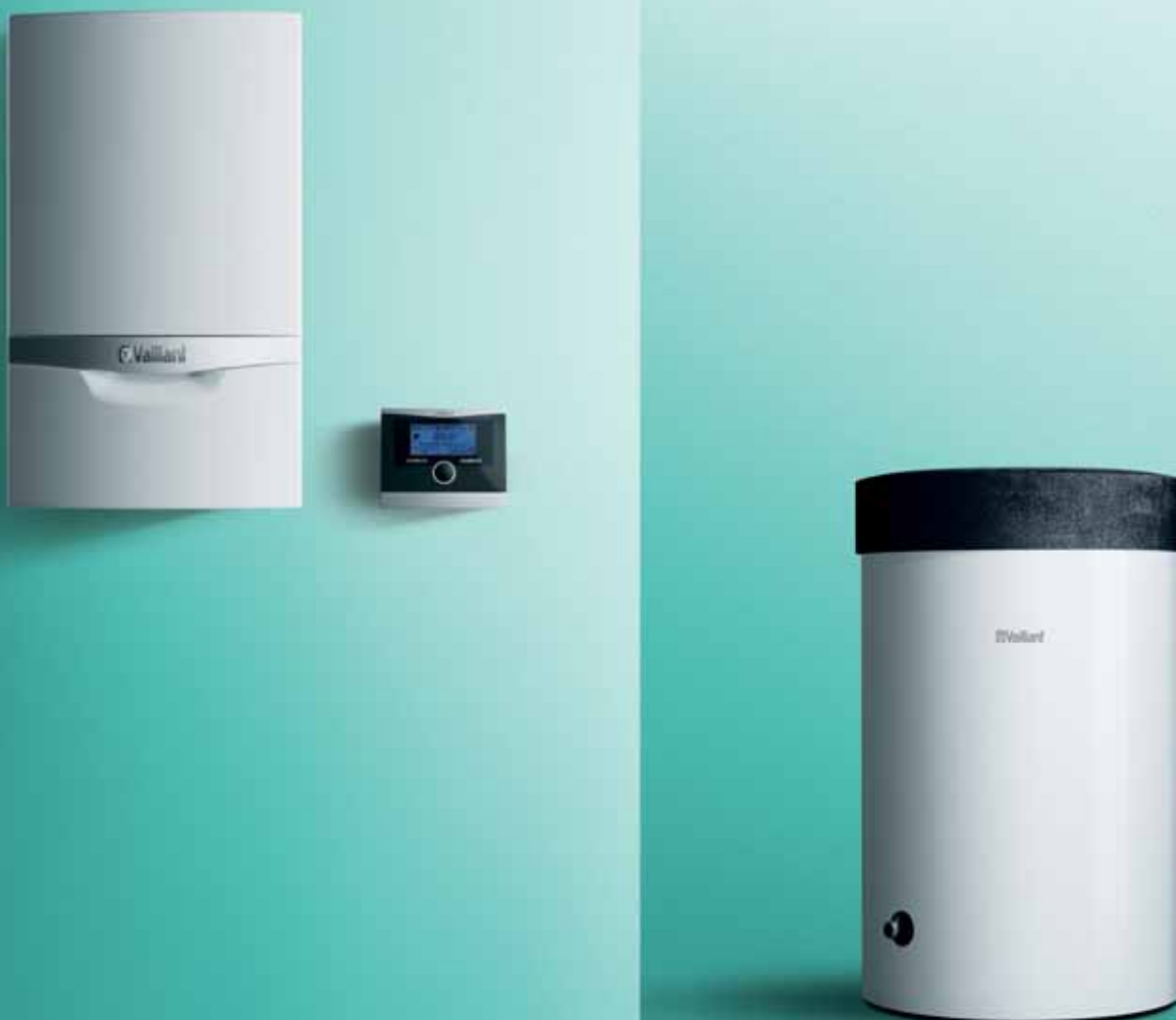
Kombinacija VU + VIH R

Kombinacija zidnog gasnog uređaja za grejanje atmoTEC/ turboTEC plus VU i rezervoara tople vode uniSTOR pruža maksimalni komfor tople vode i snabdevanje više točjećih mesta istovremeno.