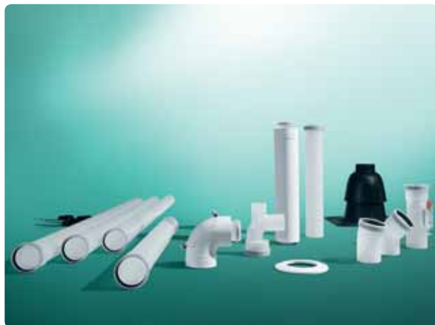
Horizontalni vazduho-/dimovodni komplet