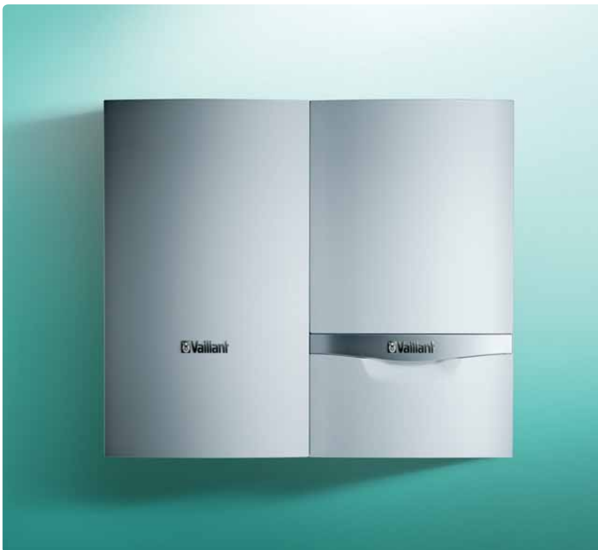
VU + VIH Q 75 B

Zidni rezervoar uniSTOR VIH Q 75 B dizajnom je potpuno prilagođen konvencionalnom zidnom gasnom uređaju za grejanje (VU). Moguće ga je postaviti levo ili desno pored uređaja. Rezervoar je, kao i cevna zmija, sa strane sanitarne vode emajliran