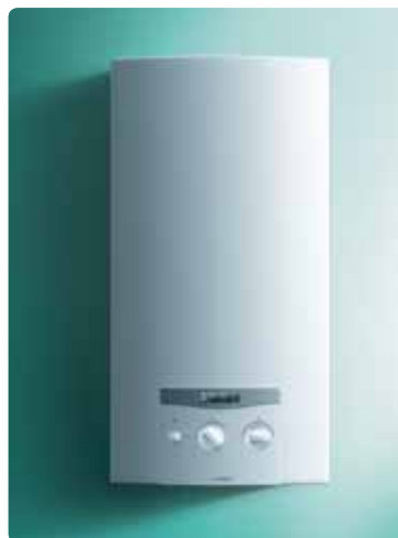
atmoMAG XZ mini