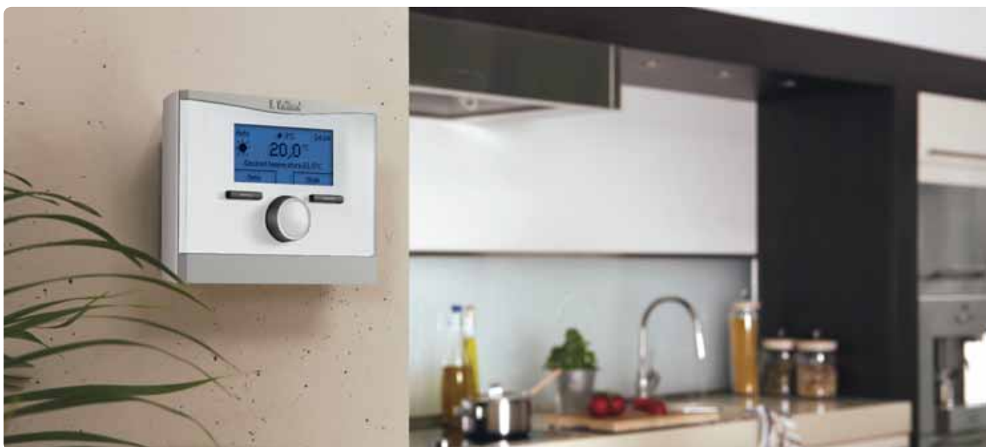
Atmosferski regulator multiMATIC VRC 700