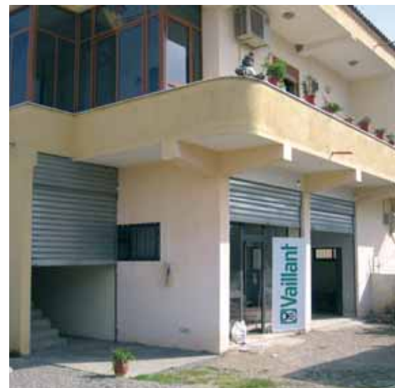
Poslovnica tvrtke Albas nalazi se u industrijskom i poslovnom dijelu Tirane - Astiru