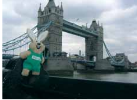
Zeko je ovoga ljeta bio neko vrijeme s kolegicom iz Vaillanta i u Londonu