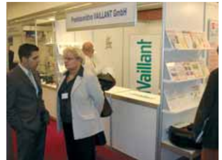
Informacije o svim Vaillantovim proizvodima bile su dostupne na našem štandu