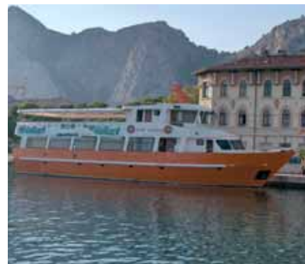
S Jure Joskanom smo plovili splitskim morem

Brojne pohvale upućene na račun prošlogodišnje zajedničke prezentacije Aquatherma i Vaillanta na brodu u Dubrovniku, potaknule su nas na ponavljanje jednakog događaja i ove godine. Ovoga puta imali smo na raspolaganju dva dana, a plovili smo splitskim i zadarskim morem.