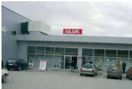
Poslovnica Luk d.o.o.-a u Visokom