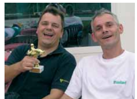
G.Gregor je i dobar vozač - osvojeno treće mjesto na Vaillant Cart utrci