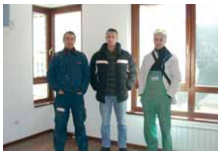
Zaposleni u tvrtkama Duljević, Frimont i Knegas

uređaja koji su se u potpunosti uklopili u specifičan dizajn unutar njihovih prostorija. Investitor Tehel d.o.o. namjerava u skoroj budućnosti graditi još apartmana na olimpijskoj planini Bjelašnici gdje će u predviđenih 300 apartmana Vaillant ponovno biti odabran kao optimalno rješenje za zadovoljavanje potreba korisnika tijekom čitave godine.