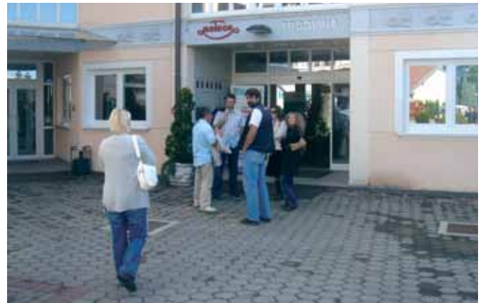
Po dolasku smo se okupili pred zgradom Meteora

Festival glazbe, ulične zabave i starih zanata, Špancirfest, održava se svake godine u Varaždinu. „Potpuni festival potpunog grada“ odvija se na brojnim varaždinskim ulicama i trgovima, a na različitim pozornicama organizirani su scenski i glazbeni događaji. Tu je također i prodajno-izložbeni program u sklopu kojeg su i degustacije tradicionalne varaždinske gastronomije. Na poziv našeg dugogodišnjeg partnera, tvrtke Meteor, i sami smo