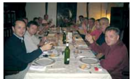
Na seoskom imanju smo uživali u baskijskim delicijama

Srijeda, posljednji dan našeg putovanja, omogućila je da se do posljednjo-odlaska kući okrenemo svojim individualnim interesima, od nabave suvenira i poklona za svoje najmilije do ispijanja kave u ugodnom društvu uz samo rijeku. Za mnoge je ovo bilo tek prvo putovanje u Bilbao te smo ostali očarani gradom, ljudima i svim blagodatima baskijske regije. U tom smislu "Agur!" kako bi rekli Baski, odnosno "Dovidenja!"