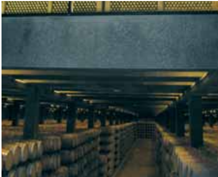
Vinski podrum Juan Alcorta sa šest milijuna butelja!

Ovaj vrlo moderan vinski podrum godišnje proizvodi 25 milijuna butelja uglavnom crnog vina. U samom podrumu vino sazrijeva od tri mjeseca do dvije godine (ovisno o vrsti) u 70.000 hrastovih bačvi. Pogled na ovakvu količinu bačvi izazvao je kod svih nas divljenje i nevjericu. No, kao da sve to nije bilo dovoljno, pogled na uskladištene butelje u kojima vino sazrijeva do kraja svog vijeka (jedna do tri godine), zaprepastio je i zadnjeg skeptika. Naime, šest milijuna (!) butelja uredno poredanih sve nas je oborilo s nogu.