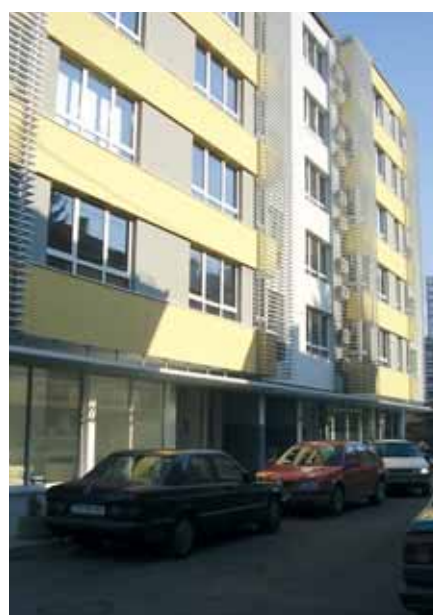
Suvremena gradnja i neobičan interijer...