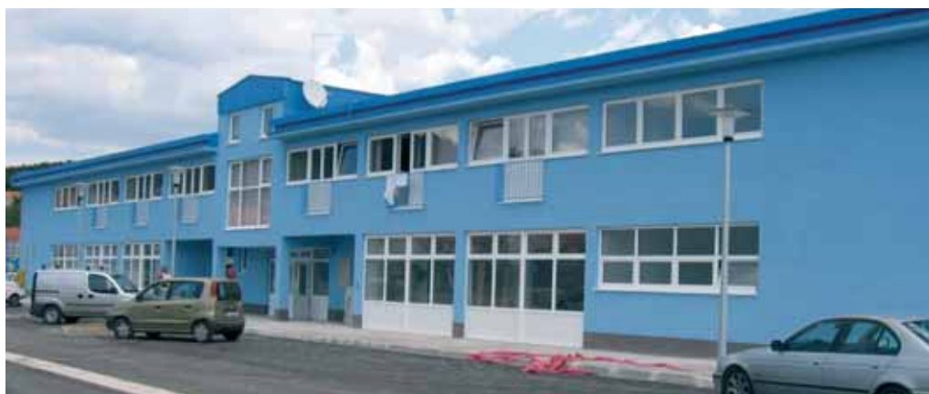
Novoizgrađeni stadion u Sinju