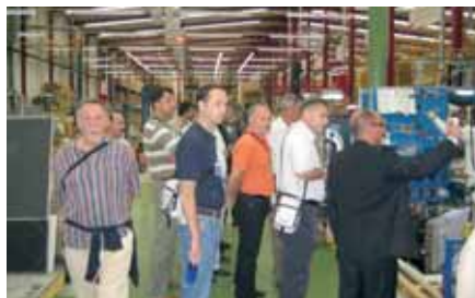
Proizvodni pogon tvornice u Vitoriji