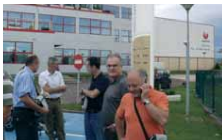
U Vitoriji se proizvode Vaillantovi klima uređaji

Sljedeći dan, u ponedjeljak rano ujutro krenuli smo prema našem prvom značajnom odredištu,