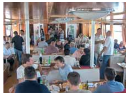
Neslužbeni dio prezentacije se nastavio na brodu