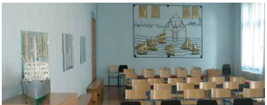
Kabineti su ukrašeni radovima učenika