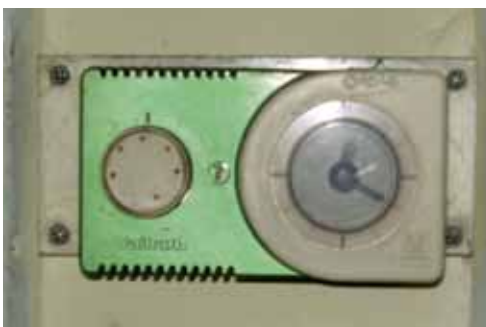
Gospodin Zlatko Vučković iz Termocommerca iznenadio nas je fotografijom Vaillantovog termostata montiranog u njegovoj kući davne 1976. godine. Sve pohvale išle su ovaj puta na račun Vaillantove izdržljivosti i kvalitete!