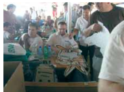
Vaillantov zec je izazvao pravu „pomamu“