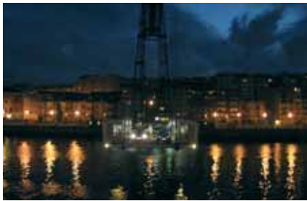
Najstariji viseći most (1888.g.) nalazi se u Getxu