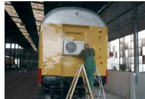
...i vanjska - ugrađene na vagon vlaka!