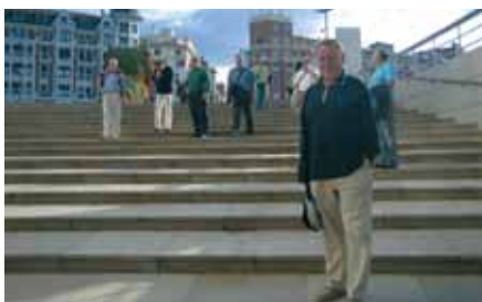
S nestrpljenjem smo žurili u muzej

Već prvi dan nam je organizirano razgledavanje glavnih znamenitosti Bilbao. Kako je hotel bio smješten u samom središtu grada, krenuli smo pješice do prve, a ujedno i najznačajnije građevine po kojoj je Bilbao postao poznat širom svijeta - muzej Guggenheim. Ispred glavnog ulaza dočeka nas je poznati divovski štenac od svježeg cvijeća koji je, iako izvorno postavljen samo za otvorenje muzeja, postao ljubimac cijeloga grada i time sam po sebi poznata znamenitost.