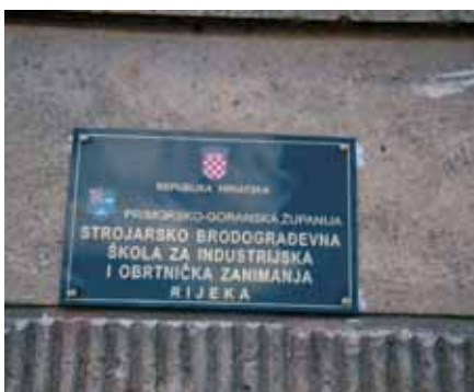
Škola se nalazi u ulici Braće Branchetta 11a u Rijeci

Promjena obrazovnog programa zahtijevala je i promjenu u opremanju ove strukovne škole. Školske praktikume, radionice i učionice bilo je potrebno adekvatno opremiti za izvođenje teoretske i praktične nastave koja prati novi obrazovni program. Tu su, dakako, bili potrebni i vanjski partneri, a Vaillant se uključio među prvima, o čemu ćemo reći nešto više kasnije u tekstu.