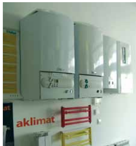
Vaillant je izložio svoje najprodavanije uređaje (Dimas)