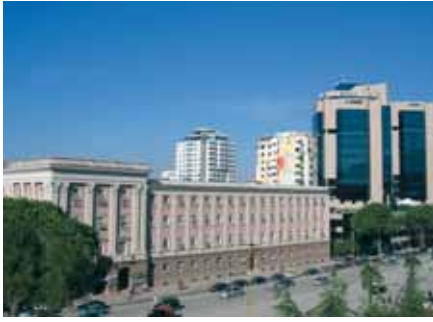
Tirana, glavni grad Albanije, je Vaillantovo novo tržište