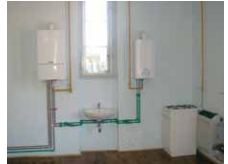
Suvremeni praktikum za plinoinstalatore

Praktična nastava se, osim u školi, odrađuje i u mnogim obrtima i tvrtkama - partnerima škole. Učenici tako provode dva dana u tjednu na terenu. Upravo ta odrada praktičnog dijela nastave u različitim obrtima i tvrtkama pruža učenicima i mogućnost stalnog zaposlenja. A to je samo dodatni razlog zašto upisati ovu strukovnu školu: „Učenici koji završe za zanimanje plinoinstalater bit će kompetentni za svoje zanimanje i brzo će naći svoj posao. Želimo da se obrazovanje još više otvori prema korisnicima uspostavljanjem različitih oblika partnerstva“, objasnio nam je gospodin Milošević.