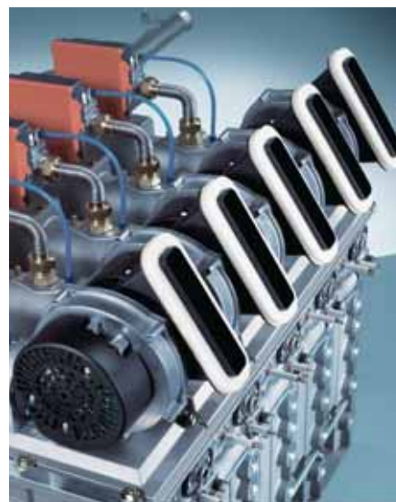
Sedam usklađenih modula - 280 kW

osobno, putem telefona ili e-mailom: info@vaillant.hr