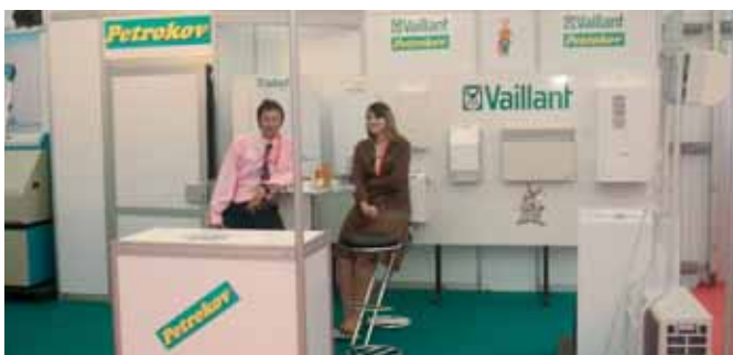
Uslužni djelatnici Petrokova na Splitskom sajmu

Sajmovi poput ovih uvijek su odlična prilika za susretanje svih Vaillantovih partnera, a krajnjim korisnicima se pruža prilika da dobiju uvid u naš cjelokupni proizvodni asortiman. Nadamo se da smo Vaillant i ovoga puta predstavili u najboljem svjetlu, a vidimo se opet na jesen!