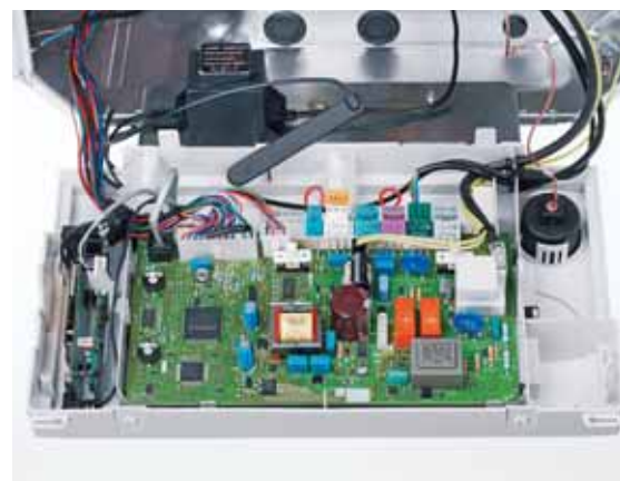
Integracija vrnetDIALOG-a 830/2 u ecoTEC

(ili ISDN), upotrebljava se za povezivanje jednog uređaja - vrnetDIALOG 830/2 - integriran GSM modul, upotrebljava se za povezivanje jednog uređaja - vrnetDIALOG 840/2 - potreban je analogni telefonski priključak