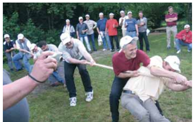
Povlačenje konopa je iziskivalo timski duh