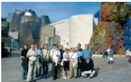
Muzej Guggenheim učinio je Bilbao poznatim širom svijeta

Još pod dojmom upravo videnog, krenuli smo autobusom na ručak u regiju poznatu po vinogradarstvu zvanu Rioja i to kod najvećeg europskog proizvođača vina. Ovaj vinogradar kontrolira posjede od 5000 ha, od toga 50 ha vinograda okružuje vinski podrum, Bodega Juan Alcorta, koji smo tom prilikom posjetili. Sam se podrum, također, odlikuje superlativima. Površina podruma i pripadajućih prostorija restorana i trgovina iznosi 45.000 m 2 u tri razine.