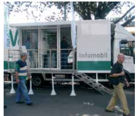
Novooslikani Infomobil na Zagrebačkom velesajmu

Prvi u nizu sajмова bio je Jesenski međunarodni zagrebački velesajam, održan u razdoblju od 19. do 24. rujna. Naš Infomobil je i ove godine bio smješten ispred paviljona 8a, a kod uvijek nasmijanih i ljubaznih djelatnika Predstavništva bilo je moguće dobiti prospekte i brošure za sve Vaillantove proizvode. Oni su, pritom, odgovarajući na brojna pitanja riješili mnoge nedoumice vezane uz aktualnu sezonu grijanja.