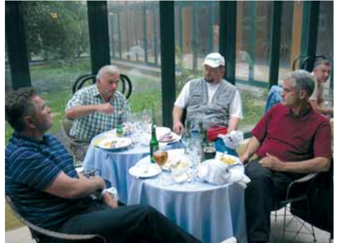
Druženje na prošlogodišnjoj skupštini KIV-a na Plitvicama

godine mu se smiješi nagradno putovanje.