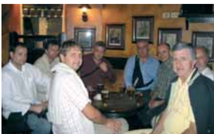
Nijedno putovanje ne može proći bez posjete irskom pubu

Budući da je cijeli dan bio ispunjen raznolikim novim utiscima, uvečer smo odlučili usporiti i prošetati do stare jezgre grada. Otišli smo pogledati kako stanovnici Bilbao provode večer, šetajući ulicama ili družeći se s prijateljima u lokalnim tapas barovima. I mi smo kušali lokalne tapas zalogajčiće ili kako ih Baski na svom jeziku zovu pintxos. Za one neumorne, večer je završila u obližnjem irskom pubu uz pivo, dok