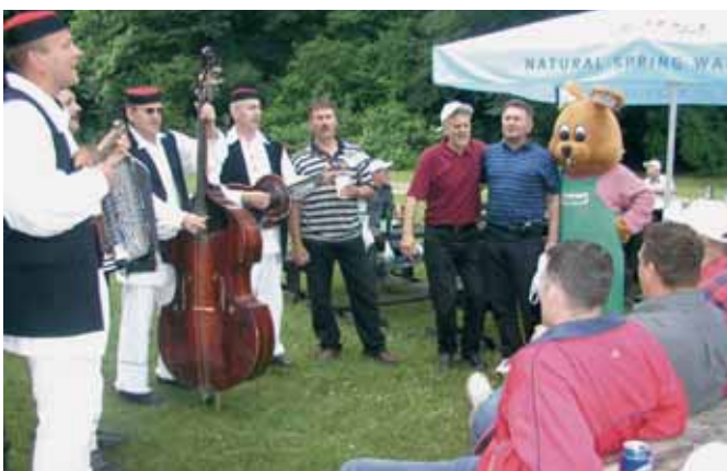
Neslužbeni dio skupštine je uvijek najzabavniji