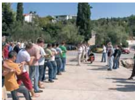
Povlačenje konopa se odigralo na rivi