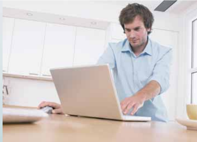
vrnetDIALOG interaktivni komunikacijski sustav

Svakodnevni razvoj napredne tehnologije donosi razne promjene u mnogim područjima industrije, a samim time i u tehnici grijanja i pripreme potrošne tople vode. Napredni sustavi današnjice, ali i sutrašnjice moraju osigurati i naprednu komunikaciju između navedenih područja i organizacije koja provodi nadgledanje.