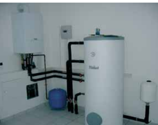
Jedna od kotlovnica u kojoj je ugrađen Vaillantov zidni kondenzacijski uređaj

S Vaillantovim sustavima i rješenjima budućnost je počela već sada.