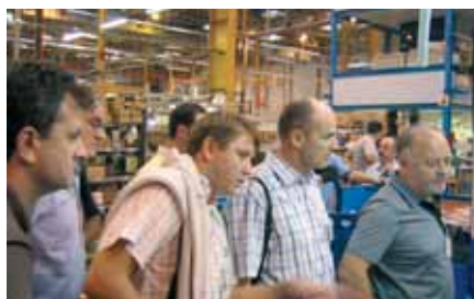
U gradiću Bergara se proizvode popularni magiči

U utorak ujutro krenuli smo na svoju drugu značajnu destinaciju na ovom putu, u gradić Bergara. Ovdje Vaillant Group ima svoj proizvodni pogon za plinske protočne grijače vode, poznatije pod nazivom MAG. Dugi niz godina ovdje se u sklopu uspješnog joint-venture poslovanja između Vaillanta i Fagora, proizvode plinski grijači vode za obje tržišne marke istodobno. Nakon dobrodošlice i nekoliko riječi o poslovanju uputili smo se u proizvodni pogon, gdje smo se mogli uvjeriti u tipičnu Vaillantovu tehnologiju rada kakvu poznajemo i iz matičnog proizvodnog sjedišta za zidne uređaje u njemačkom Remscheidu. Sva osnovna načela rada kao standardizacija, JIT, One-Piece-Flow, 5S, vizualizacija i statistička kontrola procesa primjenjuju se neizostavno i u ovom proizvodnom pogonu te jamče poznatu i provjerenu Vaillantovu kvalitetu ne samo u svim