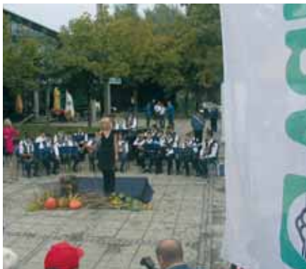
Svečano otvorenje Osječkog jesenskog sajma

I ove jeseni smo posjetili sajamske gradove u svim krajevima Hrvatske. Vaillantov novooslikani Infomobil imao je „pune kotače posla“. Zagreb, Osijek, Rijeka i Split bili su samo veće stanice na njegovom putu.