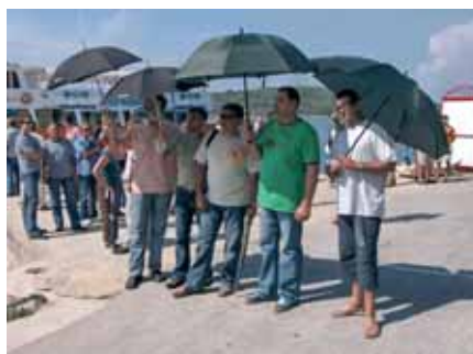
Pobjeda je timu donijela Vaillantove kišobrane