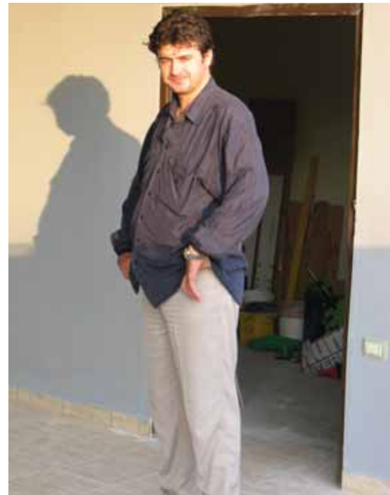
G. Mentor Breganaku radio je s Vaillantovim proizvodima u Engleskoj

Sukladno našoj tradiciji, a i poslovnim kvalitetama našeg novog partnera, Albanija će zasigurno postati još jedno značajno tržište Vaillantovih proizvoda na zadovoljstvo naših partnera i nas na jednoj strani, ali i krajnjih korisnika na drugoj.