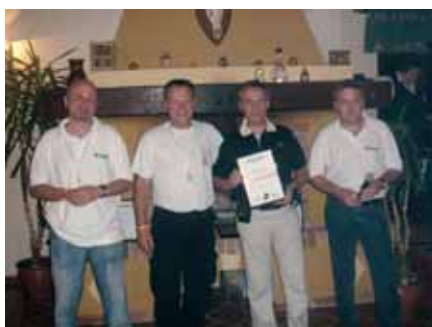
15 godina uspješno surađujemo i sa servisom El-plin