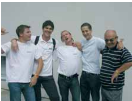
Najživlja je bila ekipa iz Aki-d-voda

No, potaknuti rezultatima koje smo ostvarili i zajedništvom koje smo stvorili, vjerujemo da će Vaillant i VSS na njih odgovoriti uspješno i s lakoćom.