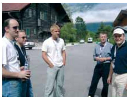
Zagrijavanje na skupu serviseru u Bohinju