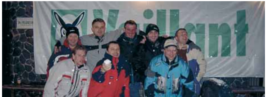
Na skijanju s Vaillantovim serviserima

Dokumentacija koju tvrtka vodi za svakog svog klijenta trebala bi biti školski primjer i za sve ostale.