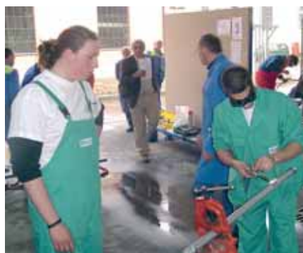
Dečke smo obukli u Vaillantova radna odjela