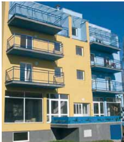
Stambena zgrada u zagrebačkom naselju Slobodština

Cjelokupni sustav od višestruke je pomoći korisniku i serviseru koji je zadužen za održavanje. Krajnji korisnici više ne moraju voditi računa o svom uređaju jer cjelokupnu brigu i nadzor preuzima Vaillant u suradnji sa svojom servisnom organizacijom. U slučaju smetnje u radu uređaja, komunikacijski sustav javlja putem SMS poruke, e-maila ili telefaksa da je došlo do smetnje u radu i serviser može u kratkom roku intervenirati. Poruka dobivena od vrnetDIALOG-a povezana je s DIA sustavom kojim se koriste naši uređaji kako bi serviser od samog početka smanjio izvor problema. Samim time, ako je pogreška vezana uz određenu komponentu našeg uređaja, serviser može uzeti odgovarajući rezervni dio i smanjiti vrijeme intervencije (slučajevi kada je riječ o komponentama uređaja koje se rijetko kvare i najčešće nisu u servisnom vozilu). Pomoću vrnetDIALOG-a moguće je mijenjati i sve parametre DIA-sustava te samim time ako je došlo do ikakvih promjena u cjelokupnom sustavu, serviser može jednostavnom izmjenom vrijednosti prilagoditi uređaj novonastaloj situaciji.