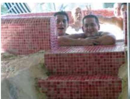
No, neki su zabušavali u jacuziju