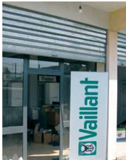
„Radno izdanje“ poslovnice Albas