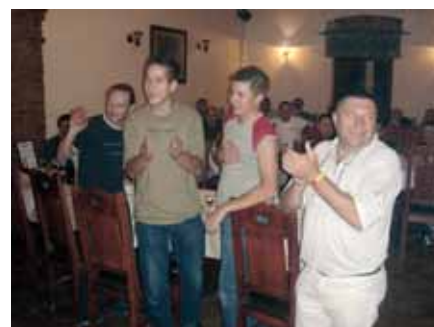
Alge su slavile pobjedu u Vaillantovoj štafeti