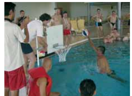
Košarkaške sposobnosti su se isto ocjenjivale