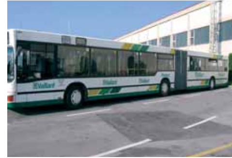
Autobus oslikan Vaillantom redovito kruži Ljubljanom