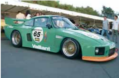
Veliki sponsor Porschea 935 u utrci „Le Mans 24 Hour race“ davne 1977. godine bio je upravo Vaillant