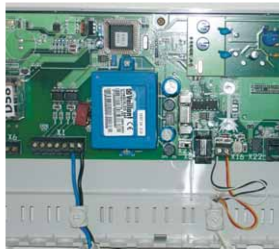
Prikaz vrnetDIALOG-a spojenog na izvor struje, telefonsku liniju i uređaje u zgradi

Prednost vrnetDIALOG-a očituje se i u njegovoj arhitekturi, odnosno programski dio sustava nalazi se na Vaillantovom serveru, što znači da je time omogućeno da svaka nova verzija vrnetDIALOGA-a (riječ je o sustavu koji se konstantno razvija) bude dostupna svim korisnicima neovisno o periodu u kojem su ugradili uređaj.