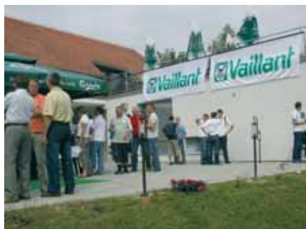
Jutarnja kavica u Sv. Martinu

Vaillant i članovi VSS-a znaju da smo zajedno jači i da uvijek možemo bolje i više. Stoga iz godine u godinu usavršavamo svoje poslovanje i u najmanjim segmentima. Tijekom zajedničkog druženja u trajanju od dva dana u međimurskom Sv. Martinu, uspjeli smo obuhvatiti sve - novosti u zajedničkom poslovanju, pohvale najboljima i ciljeve za sljedeću godinu i zanimljiva međusobna druženja.