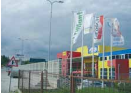
Poslovnica Kerametala se nalazi na izuzetno prometnoj lokaciji