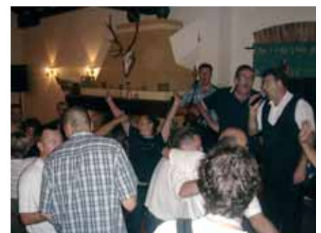
A zabava je potrajala do dugo u noć...