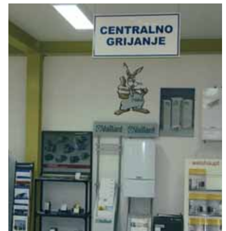
Vaillantov zeko je pronašao svoje mjesto na odjelu centralnog grijanja (Kerametal)