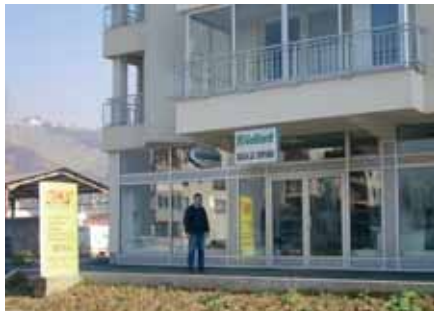
Poslovnica Dimas u sklopu novoizgrađenog stambenog objekta na lokaciji Čengić Vila