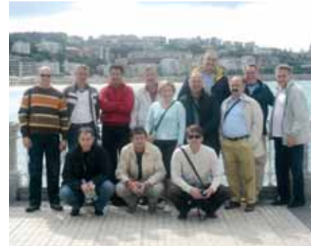
Mondeno ljetovalište San Sebastian bilo je jedna od naših stanica

proizvodnim procesima nego i za konačan proizvod.