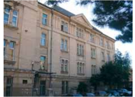
Zgrada škole je izgrađena još u vrijeme Austro-Ugarske monarhije