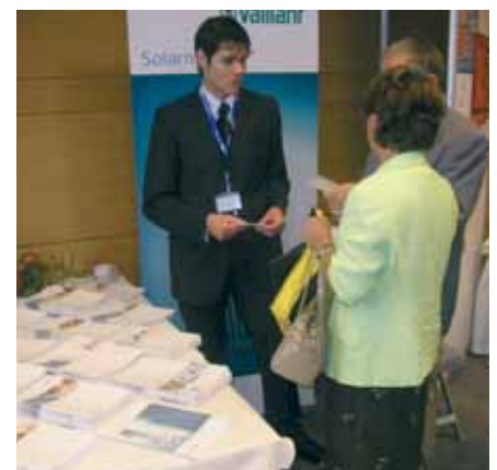
Sve stručne informacije bile su dostupne i na štandu ispred dvorane