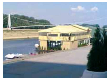
Zaista je zanimljivo gdje se sve danas ugrađuju spremnici plina...

Ukoliko i vi želite da se vaša fotografija pojavi u Vaillant plusu, slobodno je pošaljite na e-mail: vallant-plus@vallant.hr