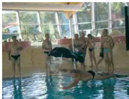
Prvi skok u vodu bio je od izuzetne važnosti