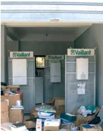
Showroom u izgradnji