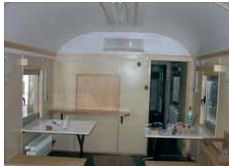
Unutarnja jedinica Vaillantovog climaVAIR-a...