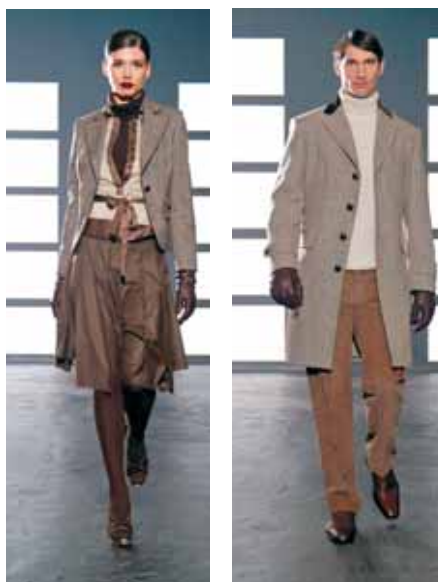
Ženska i muška linija Estare Culto

Herucovo ime povezano je s modom još od 1889 godine. Utemeljen na tradiciji i znanju, Heruc se razvijao i usavršavao kroz godine, a danas je vodeća hrvatska modna kuća koja je proširila svoju djelatnost i na strana tržišta Europske Unije, Rusije i Kanade. Herucova odjeća izrađena je od najfinijih materijala, poštujući tradicionalne načine obrade i pri-preme. Herucova modna marka Estare Culto rezultat je tradicije i umijeća oblikovanja najzahtjevnijih odjevnih predmeta: odijela, kostima i kaputa, čiju je izradu Heruc doveo do savršenstva. Muška i ženska kolekcija Estare Culto danas objedinjuje poslovni i svečani program, casual kolekciju i pret-a-porter kolekciju, namjenjenju nošenju