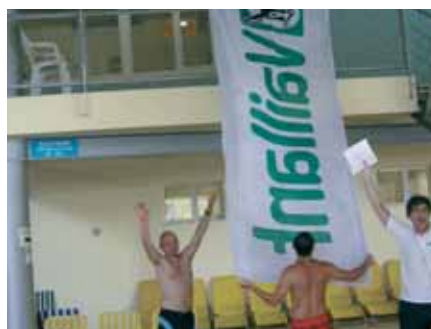
Cilj štafete je bio u što kraćem roku podignuti Vaillantovu zastavu